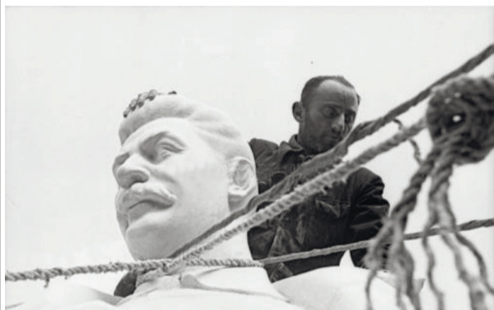
Демонтаж памятника Сталину фашистами, Белосток, июль 1941. Журналисты продолжают «демонтировать» и сегодня.

Похоже, мания не отпускает не народ, а бесчисленных писак, которые с конца 80-х годов ушедшего века состязаются в поливании грязью прошлого.