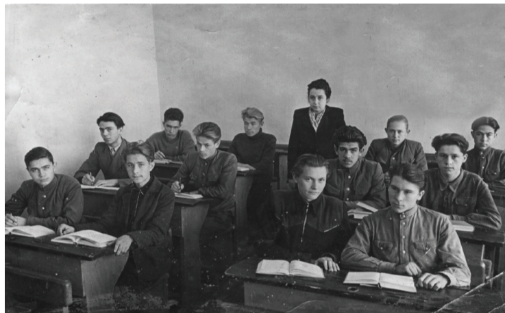
Послевоенная школа в Смоленске

Город Смоленск, июль – август 1943 года. Все чаще стали слышны «раскаты грома». Наши мамы, бабушки и дедушки говорили, что Советская Армия гонит немцев домой и, возможно, освободит Смоленск. Мы, дети, этого ждали, но не могли понять, откуда взрослые это знают. Единственное, что нам было известно, что вслух об этом говорить нельзя. Наступил сентябрь. Где-то в середине сентября немцы нас выгнали из города. Наша мама, ей всего было 27 лет, со своими тремя детьми (8 лет, 6 лет и 3 года) вместе с семьей дедушки, где тоже были одни женщины с маленькими детьми на руках, ушли под Смоленск в район деревни Александровка. Поселились в маленькой деревенской баньке в каком-то рву. Было страшно, холодно, голодно. Все терпеливо ждали. Грохот и выстрелы слышались все ближе.