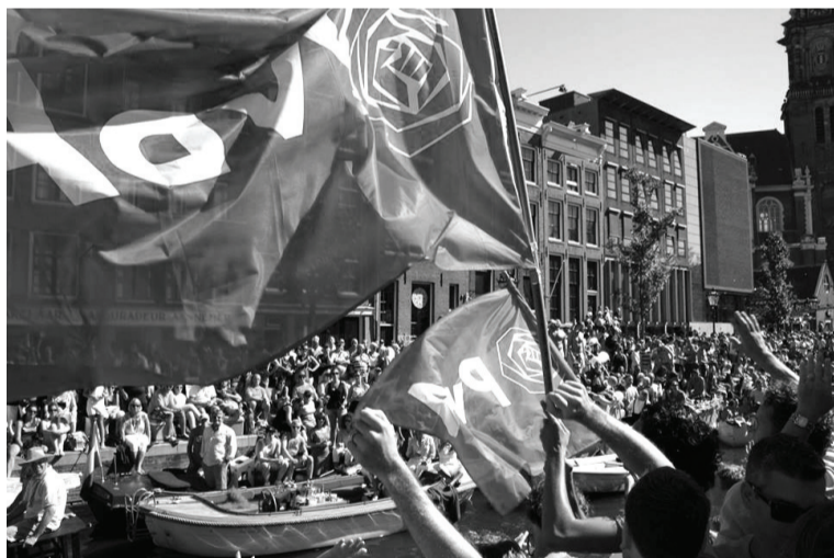
Антикапиталистический митинг Партии Труда, Нидерланды, сентябрь 2014 г.

Врагам Ленина в Беларуси действовать трудно. Поэтому оппозиционным элементам приходится прибегать к ухищрениям в виде сбора подписей за переименование улицы Ленина. Власть – не на их стороне, как на Украине, где в Харькове сотрудники МВД получают команду следить за сносом крупнейшего в Европе памятника вождю и наблюдать, чтобы в толпе не было потасовок. Циничные слова министра Авакова ярко продемонстрировали позицию власти: “Ленин? Пусть падает. Лишь бы люди не пострадали. Лишь бы этот кровавый коммунистический идол, уходя, не добавил себе жертв.”